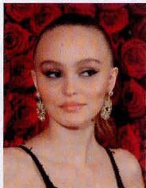
Lily-Rose Depp va illuminer les Champs.

Le 22 novembre, c'est Lily-Rose Depp qui aura l'honneur de donner le coup d'envoi des illuminations de cette fin d'année sur les Champs-Élysées.