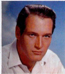
Paul Newman a affolé les enchères.

Une Rolex Daytona ayant appartenu à l'acteur Paul Newman a été adjugée en douze minutes à New York pour 17,8 millions de dollars, un record pour une montre de poignet vendue aux enchères. Conçue pour les sports mécaniques, elle avait été offerte en 1969 à l'acteur par son épouse, Joanne Woodward, alors qu'il tournait «Virages», de James Goldstone, où il incarnait un coureur automobile.